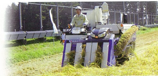
県知事による稲刈り